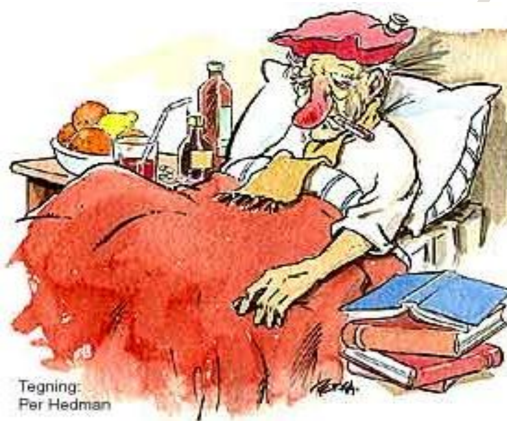
Tegning: Per Hedman